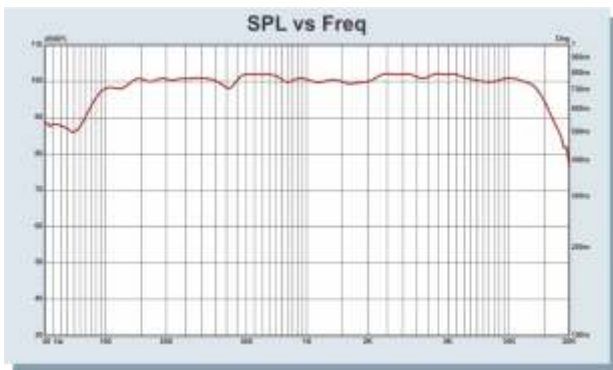
Diagrama Polar SPL