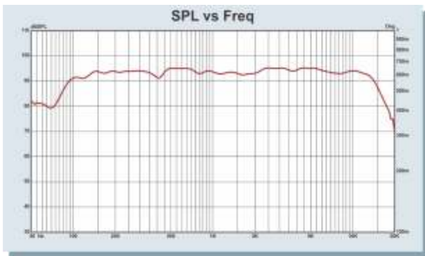
Diagrama Polar SPL